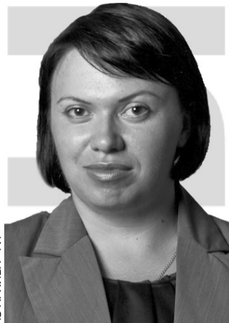
Директор PR-агентства «Фабрика Новостей».

Вопрос следующего номера: «Представитель ЛДПР Игорь Лебедев предлагает направить в Госдуму законопроект о расширении права граждан на самооборону. Так называемая доктрина крепости разрешает все доступные способы обороны от злоумышленников, проникших в дом или в автомобиль, далее планируется легализация огнестрельного оружия. Как Вы думаете, стоит ли упрощать правила пользования оружием?» *